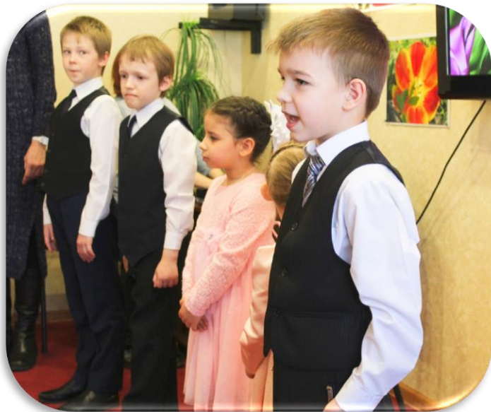
ПРАЗДНИЧНОЕ МЕРОПРИЯТИЕ В РАМКАХ ОБЛАСТНОГО МАРАФОНА «ЖИВИ ЯРКО – ДЕЛАЙ ДОБРО»