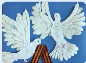
«Письма в небо»

Объединение по интересам, развитие творческих способностей детей с ограниченными возможностями и их родителей в рамках взаимодействия с добровольцами – сверстниками и представителями старшего поколения