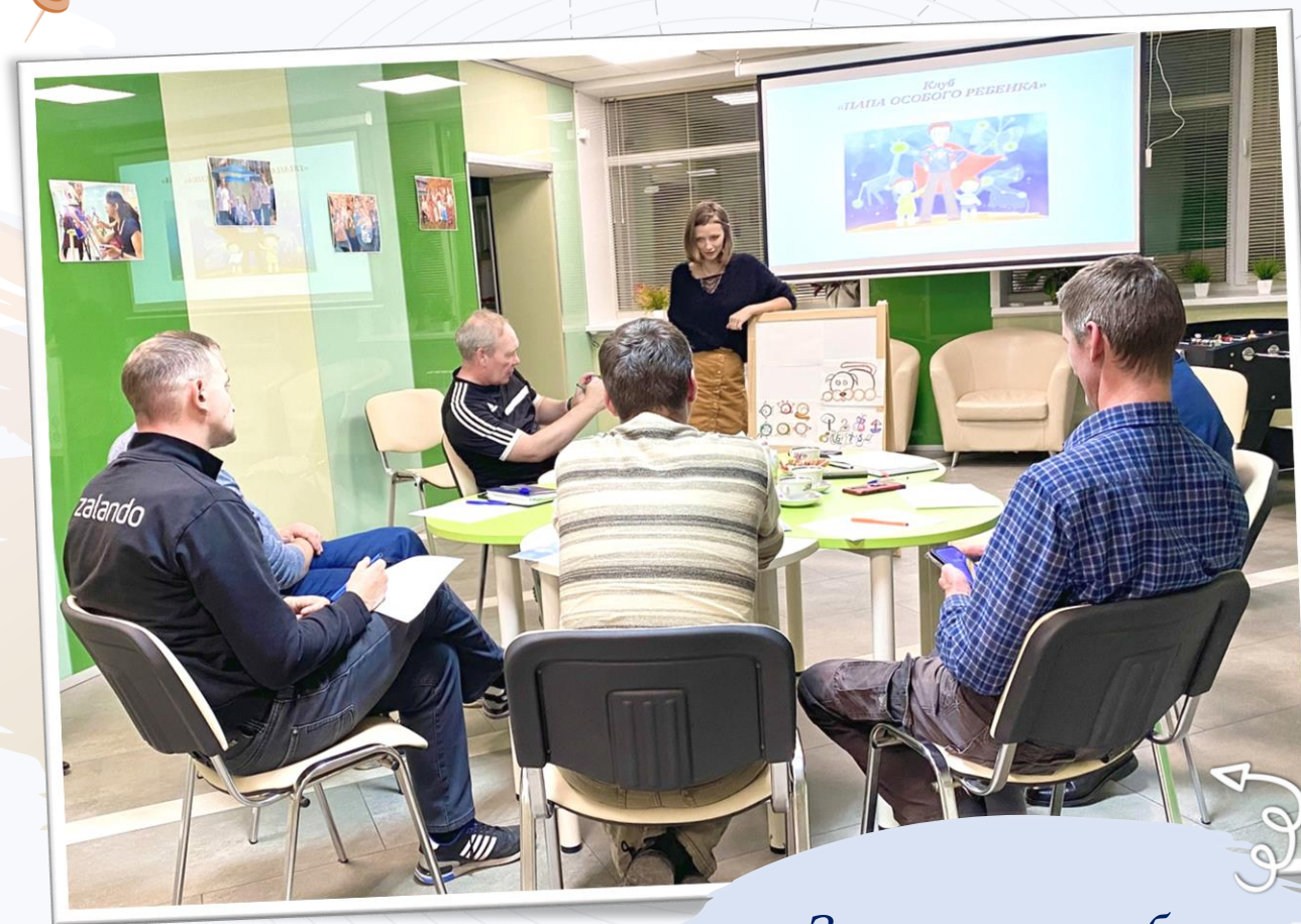
Занятие в клубе

«Клуб «Папа особого ребенка» предусматривает построение системной работы по включению отцов в процесс реабилитации, основанной на проведении практических тренингов консультативной, образовательной и практико-ориентированной направленности, организацию совместных социокультурных, культурно-досуговых и физкультурно- оздоровительных мероприятий