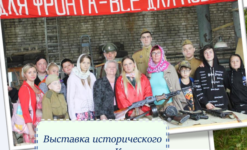
Выставка исторического оружия в г. Ковров