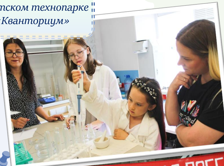
Занятия в детском технопарке «Кванториум»