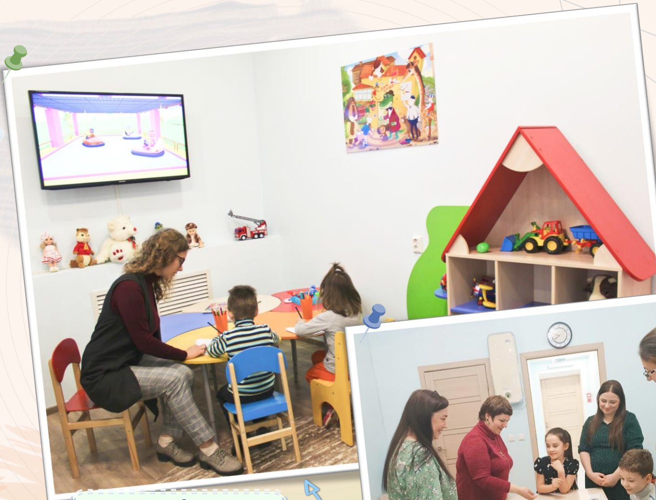
Проведение индивидуальных и групповых занятий