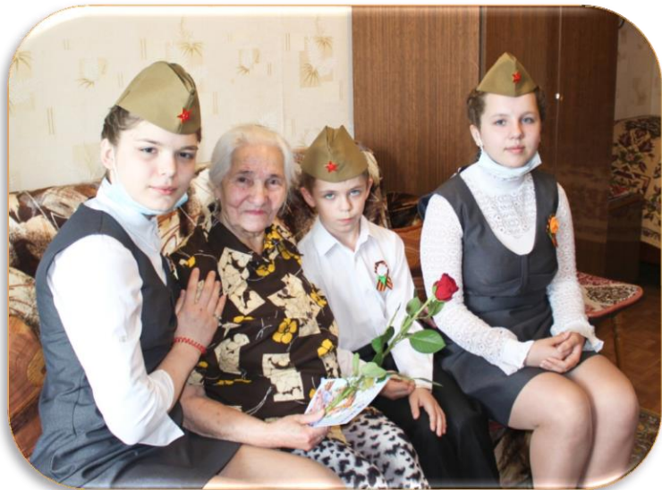
ПОЗДРАВЛЕНИЕ ВETERANОВ НА ДОМУ В РАМКАХ ПРАЗДНОВАНИЯ ПОБЕДЫ В ВЕЛИКОЙ ОТЕЧЕСТВЕННОЙ ВОЙНЕ